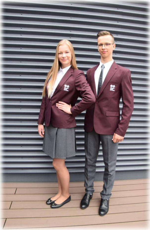
Svētku formas komplekta paraugs